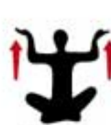
Plus fort s'il vous plaît